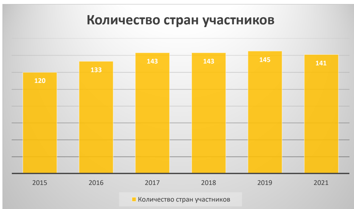
Диаграмма №2. Соотношение количеств стран участников за период 2015-2021 годов.

Дискуссии Форума проходили по четырем направлениям, на которых рассматривались вопросы мировой и российской экономики с повестками - «Национальные цели развития: от задач к результатам», «Объединяя усилия во имя развития», «Человек в новой реальности. Отвечая на глобальные вызовы», «Технологии, расширяющие горизонты». Во время проведения дискуссий обсуждались приоритетные темы для развития страны и повышения конкурентоспособности России на мировых рынках: энергетика, экология, развитие Арктики, лекарственная безопасность, креативные индустрии, поддержка малого и среднего предпринимательства, образование.