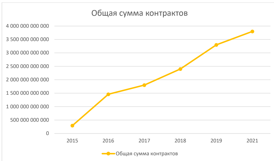
Диаграмма №4. Соотношение общих сумм контрактов за период 2015-2021 годов.

Изучив материалы прошедших форумов, мы систематизировали полученные данные (табл. 1).