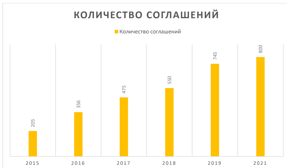
Диаграмма №3. Соотношение количеств соглашений за период 2015-2021 годов.

На Форуме было подписано более восьмисот девяноста соглашений (диаг. 3). В том числе участники Форума подписали более ста пятидесяти международных соглашений.