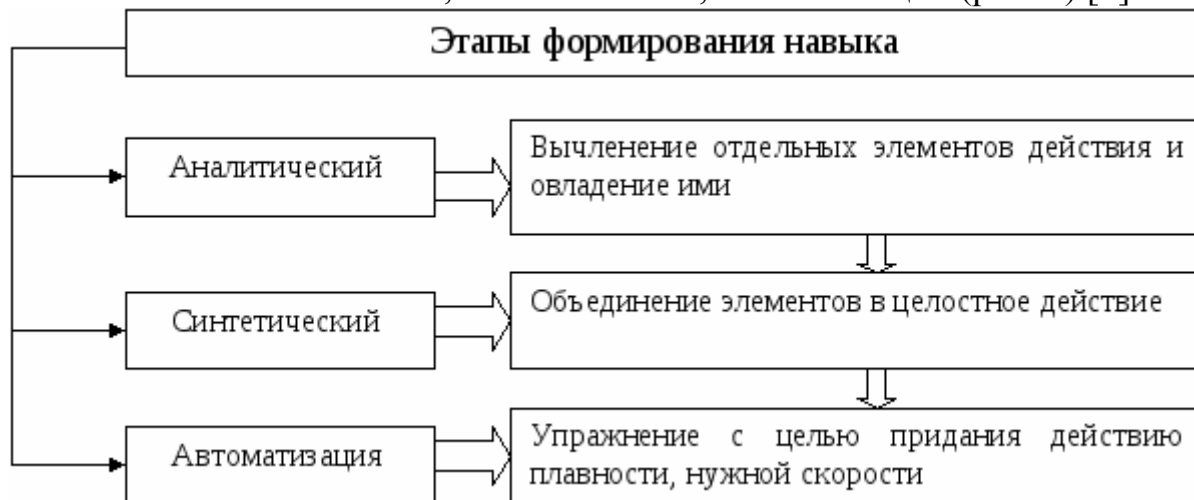
Рис. Этапы формирования игровых навыков

Как известно, навыки, в том числе и игровые, образуются в результате упражнений, т.е. целенаправленных и планомерных повторений. При этом само по себе повторение – это лишь одна сторона упражнений. По мере упражнения изменяются как количественные, так и качественные показатели работы. Таким образом, выделяются несколько этапов формирования игровых навыков: аналитический, синтетический, автоматизации (рис 1.) [4].