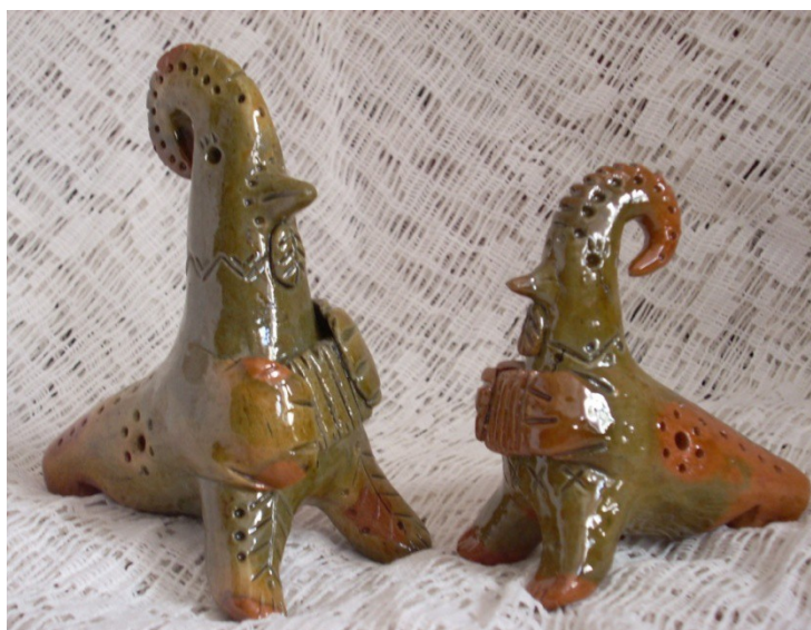
Н.Ю.Скорик. Петровская игрушка-свистулька петушок.