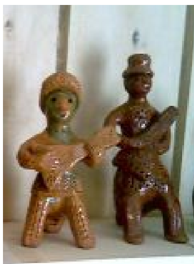
Л.Н.Гладких. Петровская игрушка-свистулька