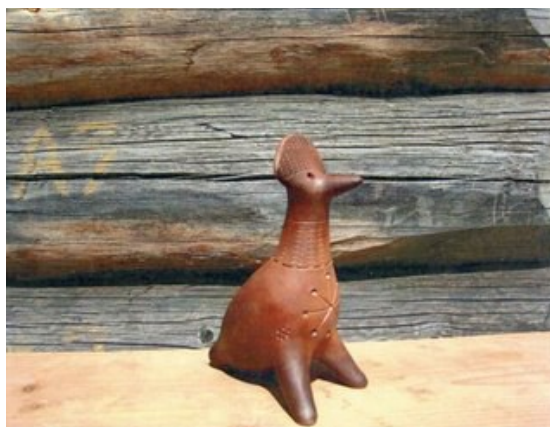
А.В.Малков. Петровская игрушка-свистулька