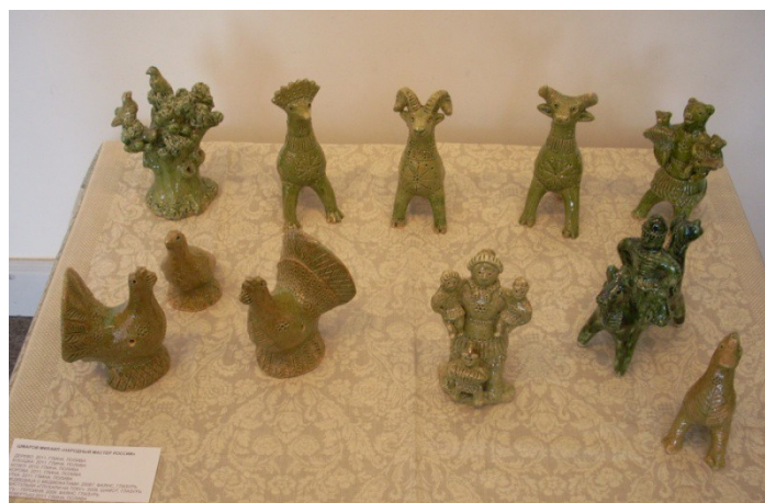
М.А.Шмаров. Петровская игрушка-свистулька