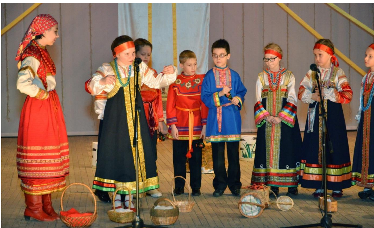
Заговоры и заклинания перед входом в лес