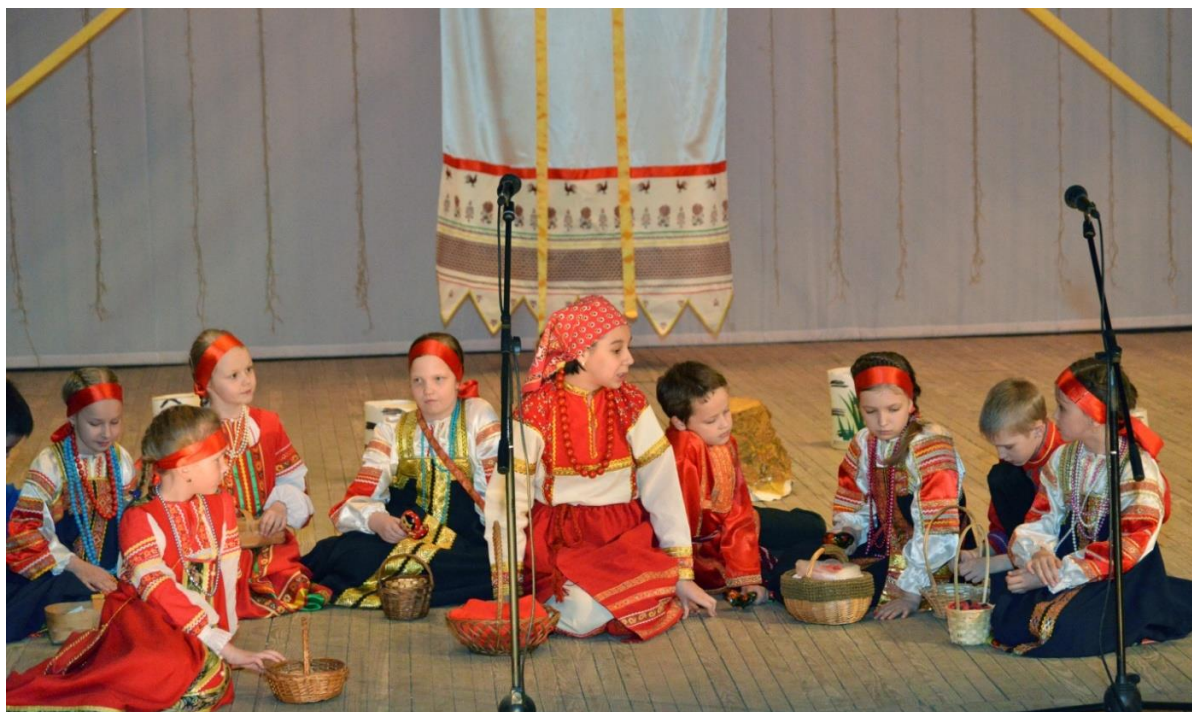
Сказание про лешего