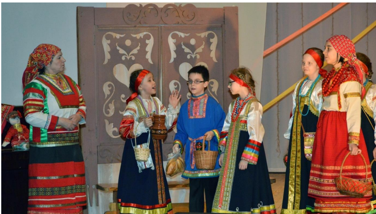
Приход за подругой в лес по грибы и ягоды