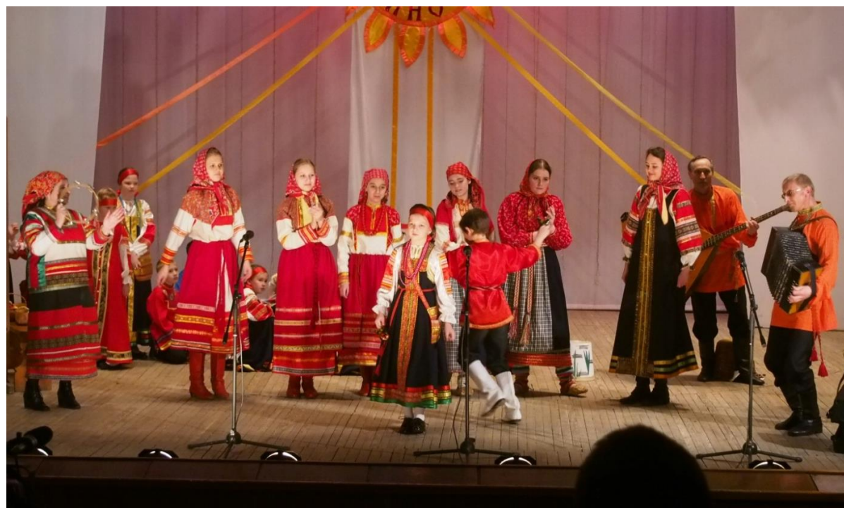
Хороводно - игровая песня «Полетел воробей во долину»