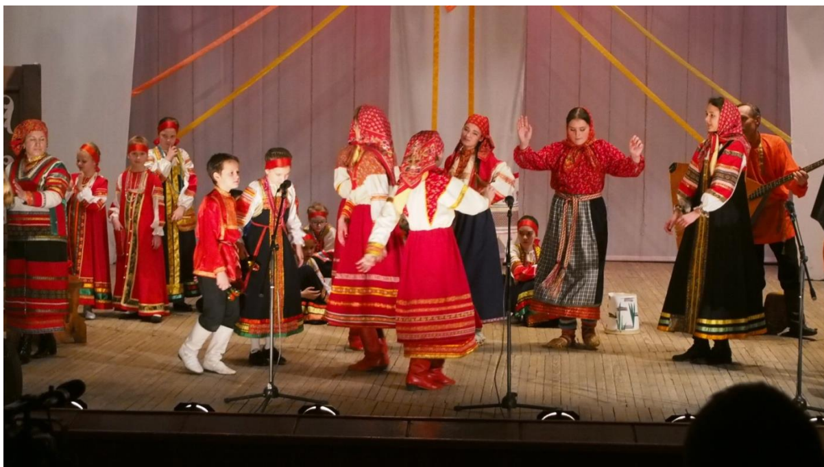
Частушки Пензенской области «А ох, подружка, моя Таня»