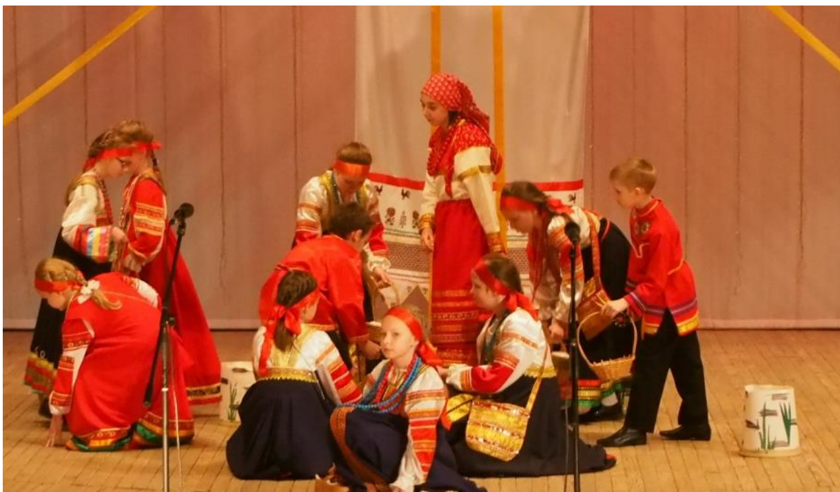
Сбор ягод на поляне