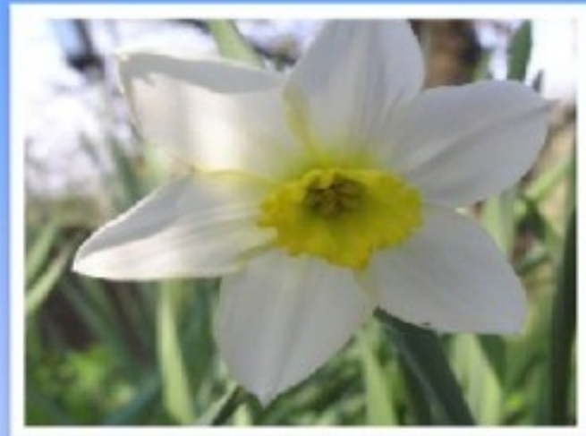
The symbol of Wales is the daffodil