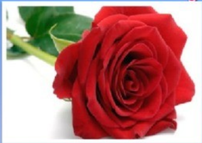
The symbol of England is the red rose