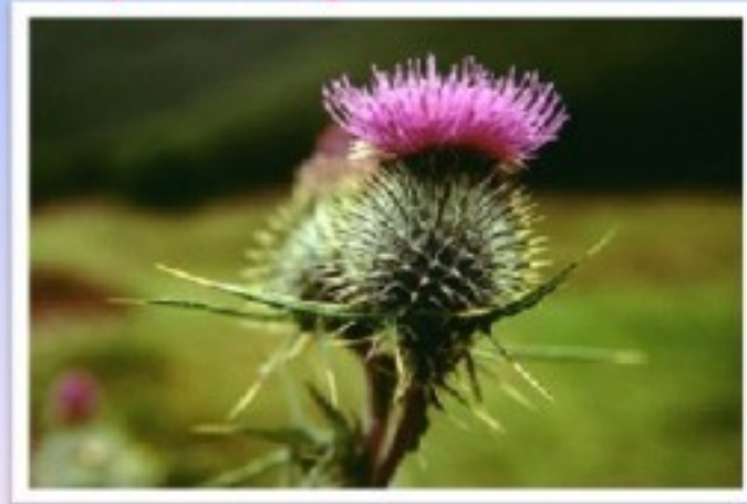
The symbol of Scotland is the thistle